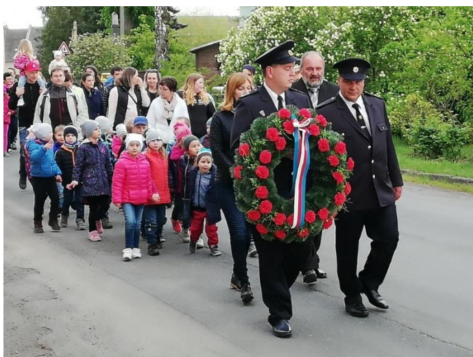
Průvod k uctění památky obětí 2. světové války