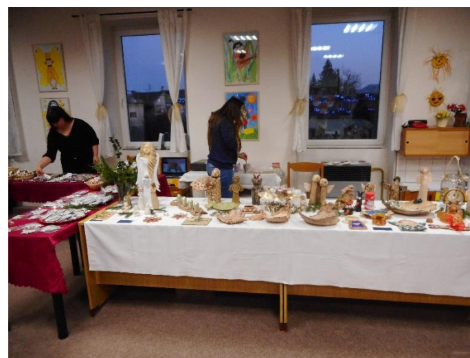
Každoroční vánoční výstavka v obecní knihovně