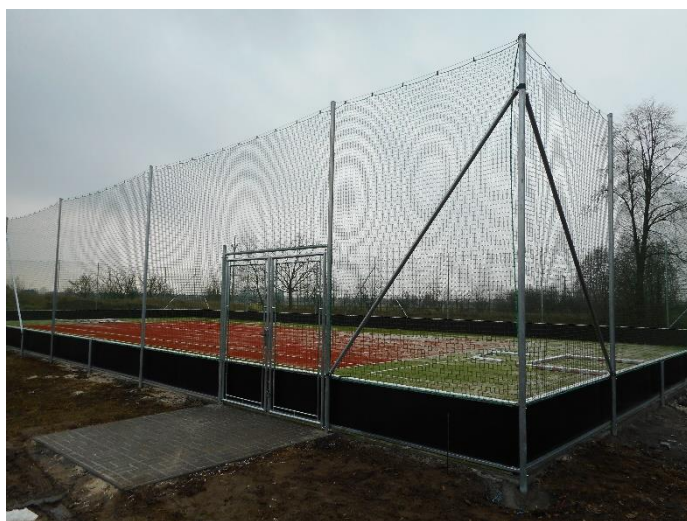
Dokončení výstavby víceúčelového hřiště včetně kolaudace