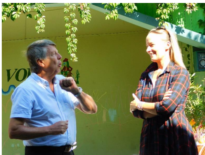
Hody v Liboši