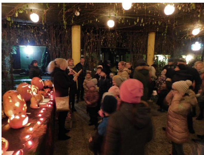
Dyniáda, každoroční soutěž pro děti ve vydlabávání nejen dýní