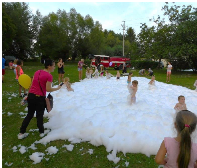
Dětský den k ukončení prázdnin ... nejlepší byla pěna, kterou vytvořili naši hasiči