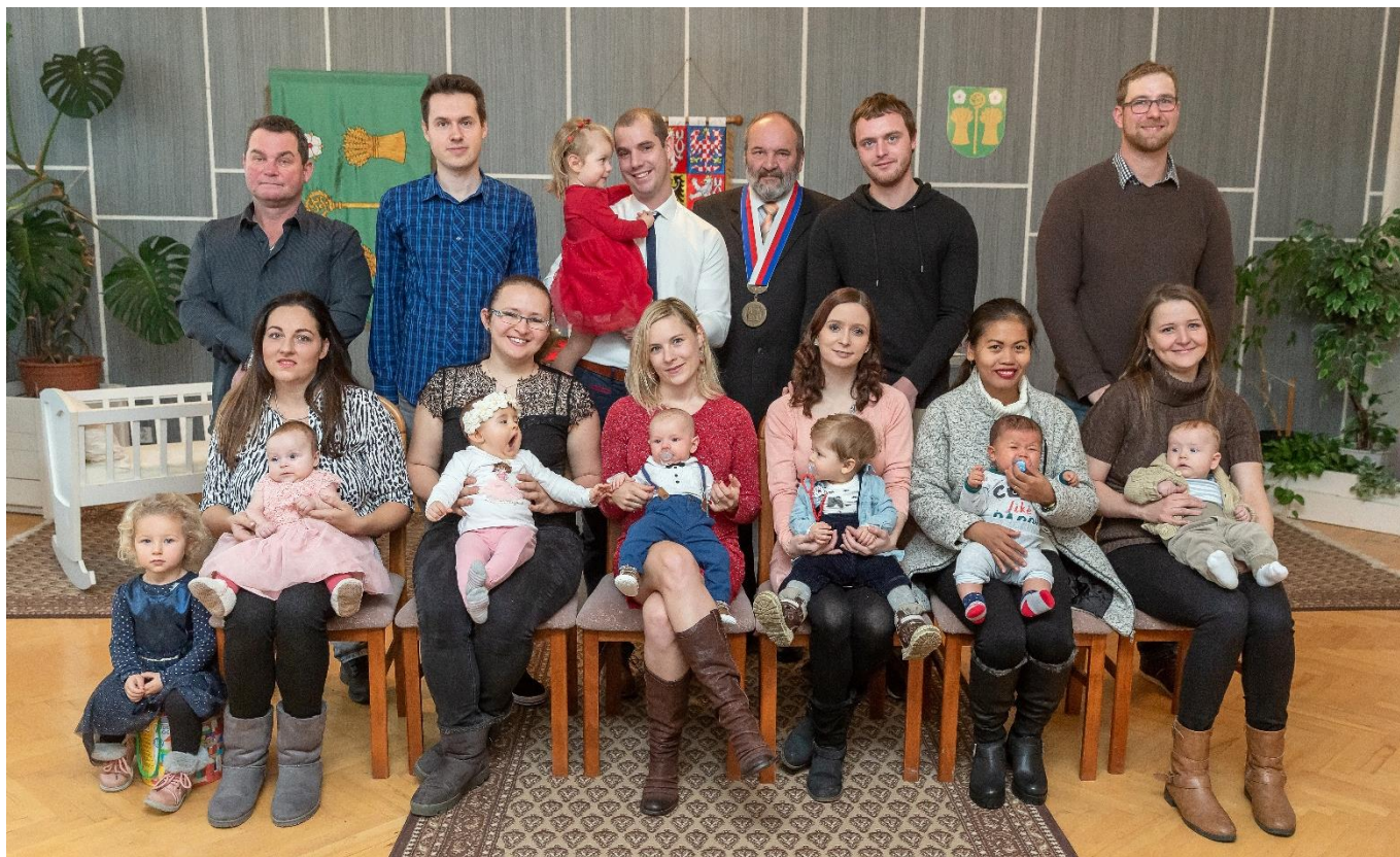
Letošní vítání nových občánků do svazku obce