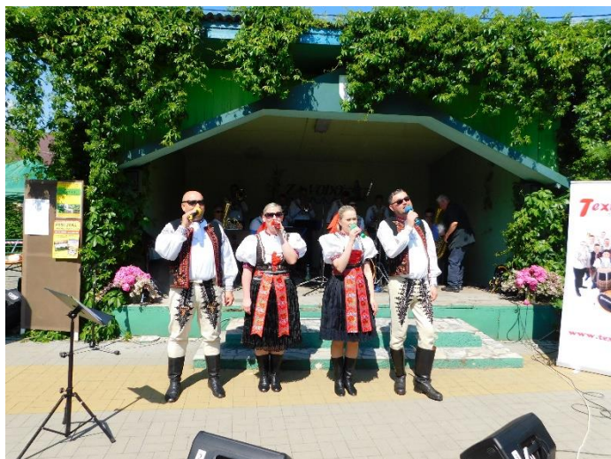
25. ročník „Festivalu malých hudebních souborů - Liboš 2019“