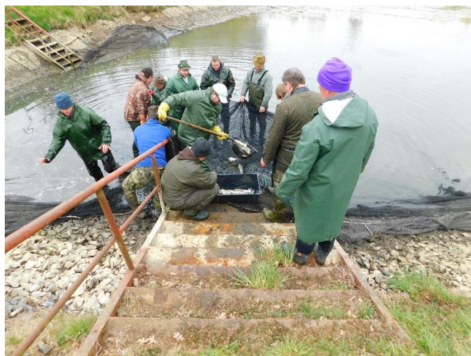
Jarní výlov rybníka na Jílkově členy rybářského svazu