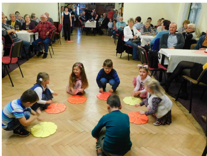
Setkání s našimi seniory a vystoupení dětí z mateřské školy