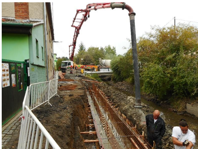
Výstavba opěrné zdi ujíždějího břehu mlýnského náhonu před plánovanou stavbou komunikace Malý Jílkov