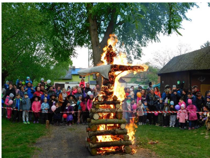
Tradiční pálení čarodějnic v režii sdružení žen a kulturní komise.