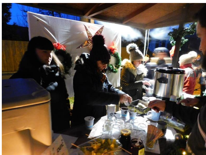
Občerstvení při rozsvícení vánočního stromu bylo připraveno sdružením žen a kulturní komisí