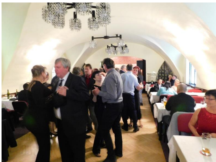
Obecní ples 2019