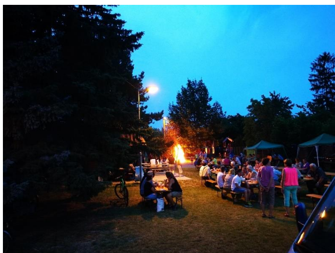
Hody v Krnově – 50 let od počátku jejich konání