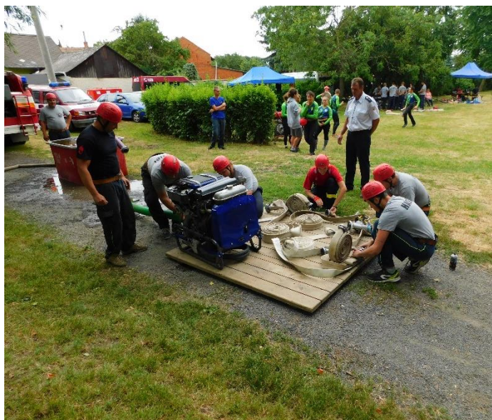
Hasičská soutěž „Memoriál Pavla Weinlicha a O pohár starosty obce“